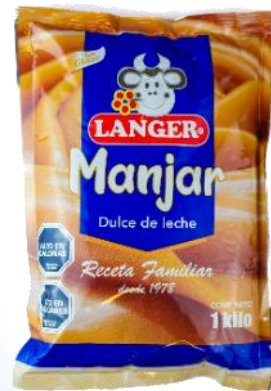
Dulce de Leche