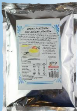
Crema Pastelera sin Azúcar