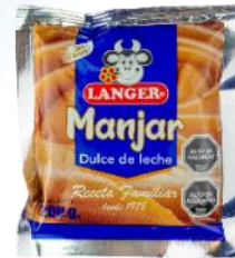
Dulce de Leche