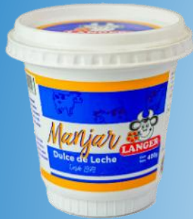
Pote dulce de leche